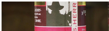
Port und Sherry