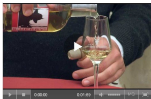
Das Kloster und das Weingut im SWR