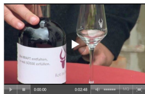
Das Kloster und das Weingut im SWR