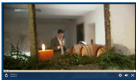
Das Kloster und das Weingut im SWR