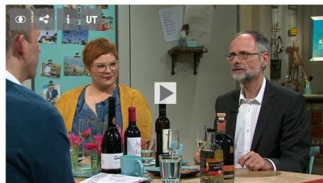
SWR Kaffee oder Tee